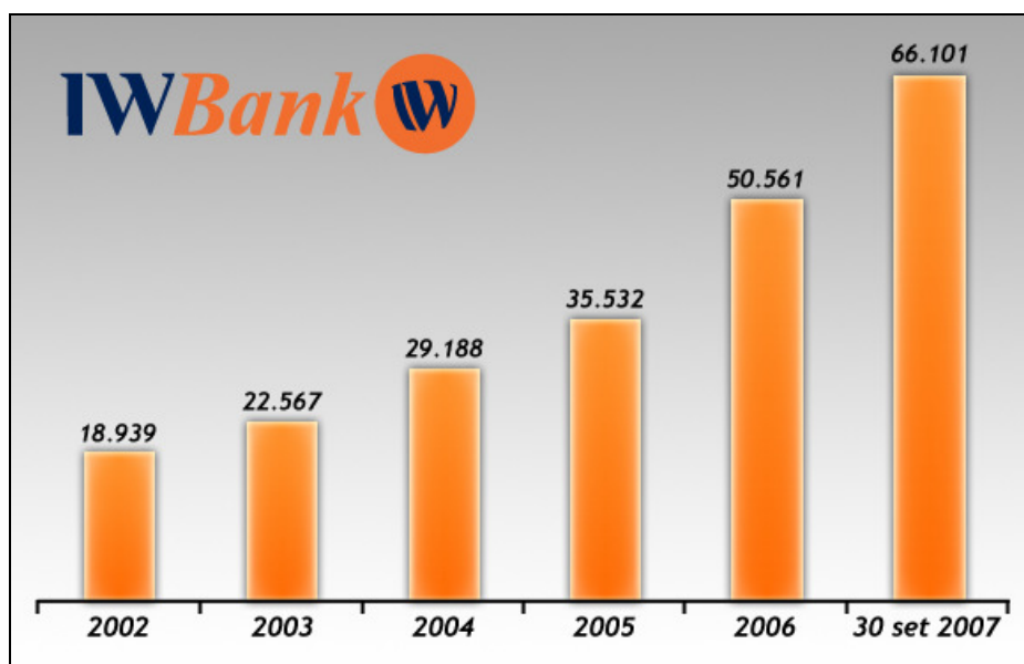
FIG. 1 – CLIENTI OPERATIVI